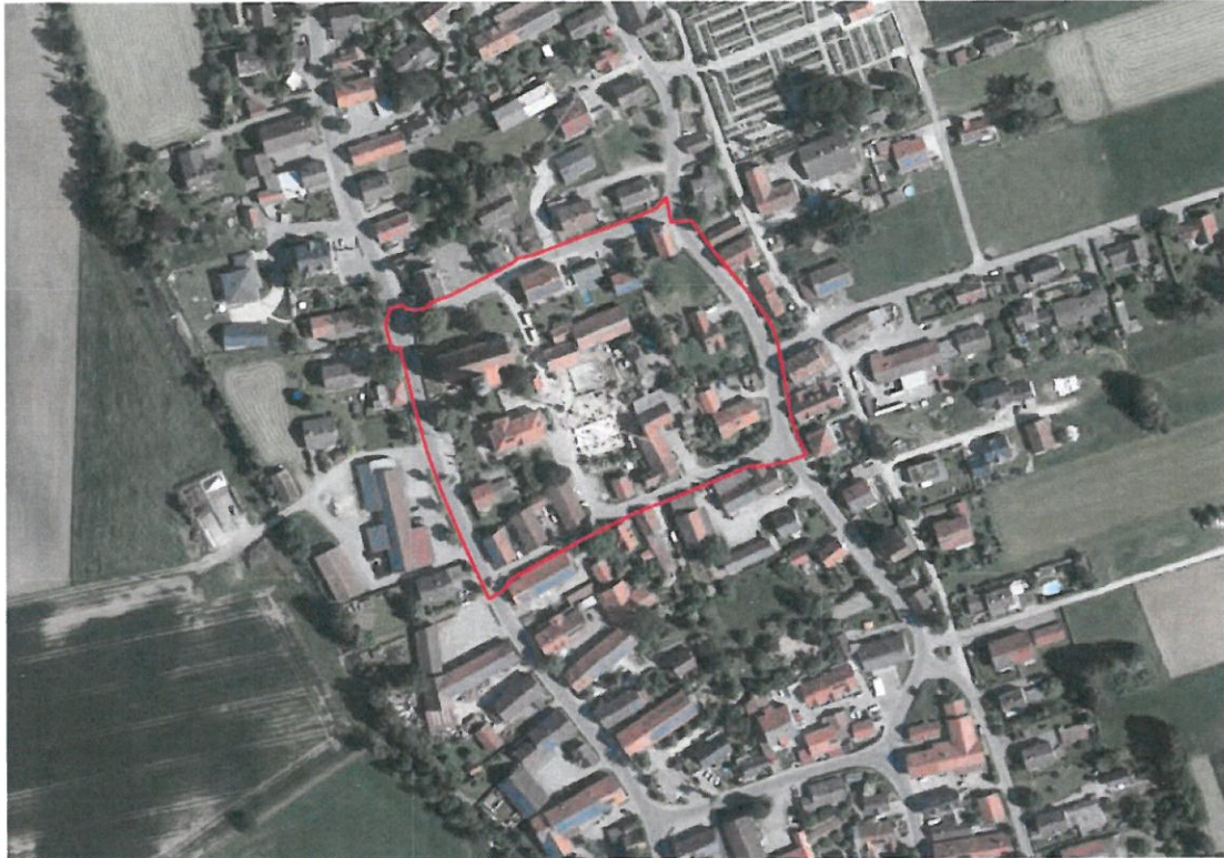
Abb. 3: Umgriff Bebauungsplan Nr. 27 „Dorfmitte“, Gemeinde Langerringen

Die bereits im Plangebiet vorhandene, entlang der öffentlichen Verkehrsfläche situierte Bebauung soll durch Festsetzungen straßennaher Bauräume auch zukünftig gesichert werden.