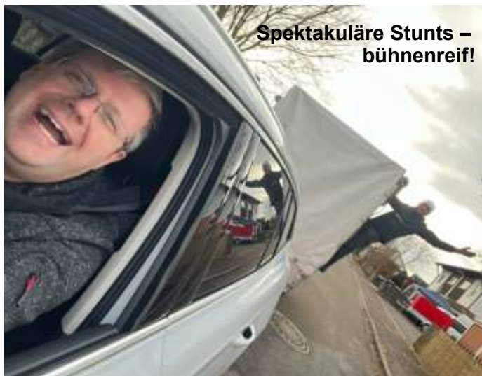
Spektakuläre Stunts – bühnenreif!

Am Abend des 2. Advents luden der Gesangverein Fröhlichkeit und der Kinderchor Ohrwurm zu einem stimmungsvollen „Stündchen Advent“ in den liebevoll geschmückten Innenhof des Feststadls Obermeitingen ein.