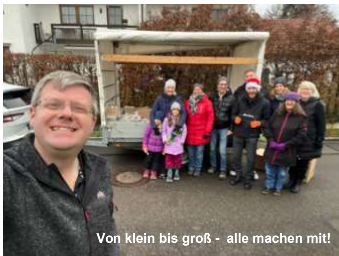
Von klein bis groß - alle machen mit!