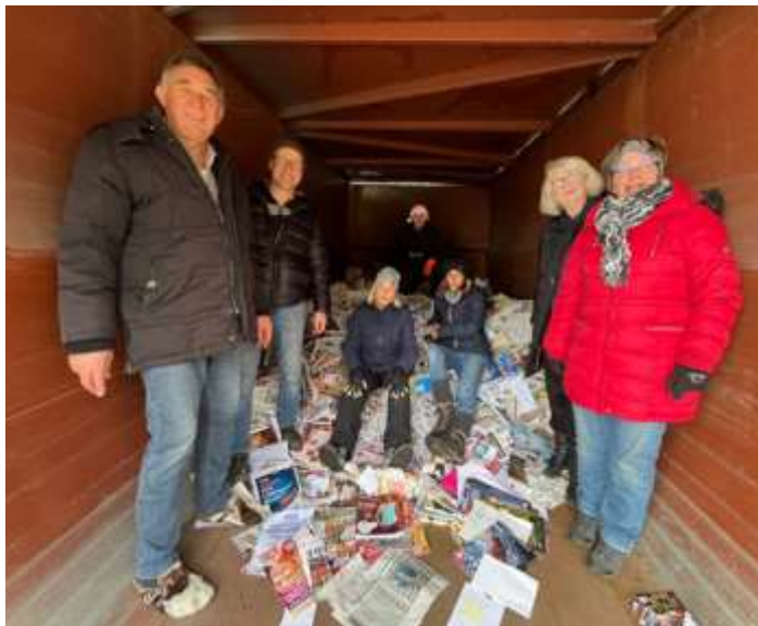
Am 6. Dezember hat der Gesangverein Fröhlichkeit Obermeitingen e.V. erneut die Altpapiersammlung der örtlichen Vereine durchgeführt. Dank der vielen fleißigen Helferinnen und Helfer lief alles zügig, gut organisiert und mit bester Stimmung ab.