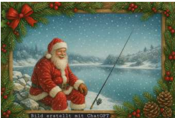
Euer Fischereiverein Obermeitingen Text & Bilder Andreas Wachs

Zuletzt möchten wir die Möglichkeit nutzen und allen Bürgern der Lechfeldgemeinden ein ruhiges und beschauliches Weihnachtsfest wünschen. Des Weiteren wünschen wir einen guten Rutsch ins Jahr 2026.