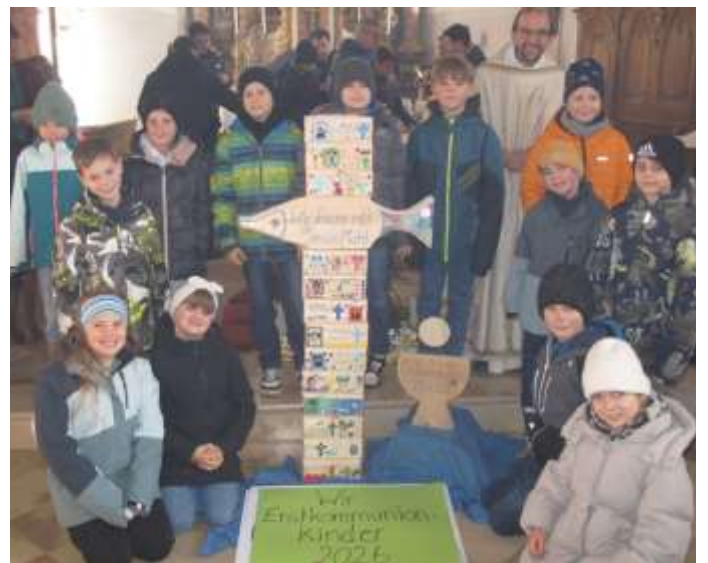
Text und Fotos: Melanie Weihmayer

Die Feier der Erstkommunion ist 2026 in Obermeitingen am Samstag, den 25. April.