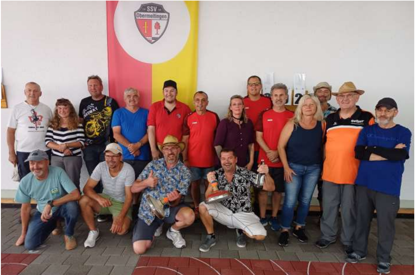
Die ersten vier Mannschaften.