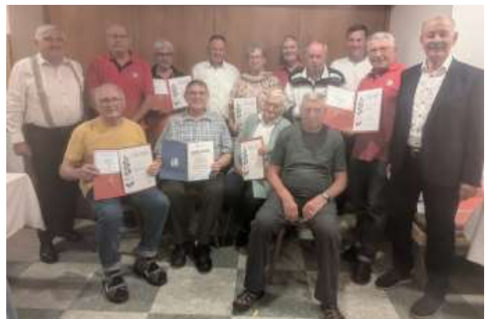
Die geehrten Mitglieder

Viele langjährige Mitglieder wurden geehrt. Eine Bestätigung auf eine langjährige gut funktionierende Abteilung.