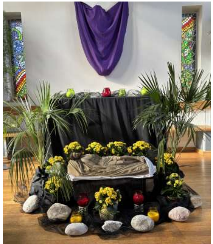
Heiliges Grab 2025, Foto: Priska Preisinger

Das ganze Jahr über wird die Kapelle im Zeichen des Kirchenjahres geschmückt.