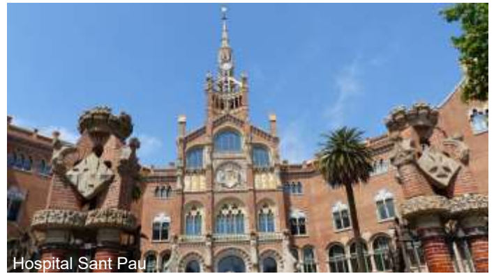
Hospital Sant Pau