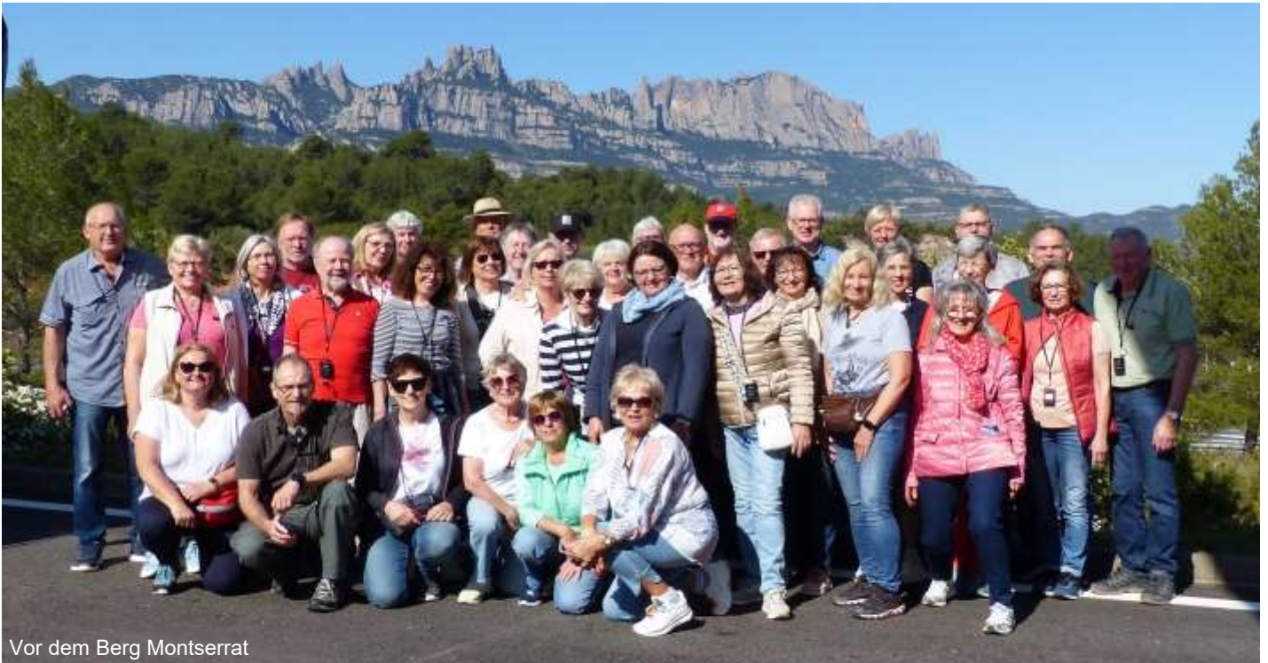
Vor dem Berg Montserrat