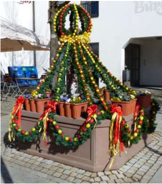
Osterbrunnen in Obermeitingen

Der Obst- und Gartenbauverein Obermeitingen e. V. hat wie jedes Jahr den Dorfbrunnen österlich geschmückt.