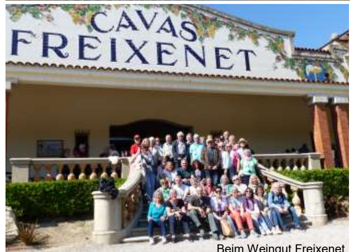
Beim Weingut Freixenet