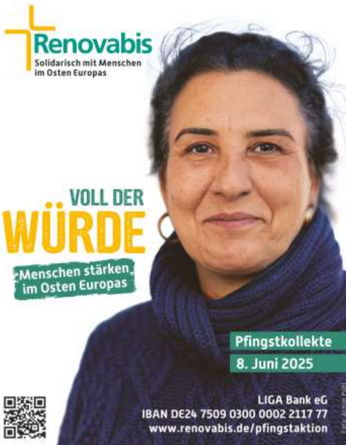
Plakat: Renovabis in Pfarrbriefservice.de

Das ganze Jahr über wird die Kapelle im Zeichen des Kirchenjahres geschmückt.