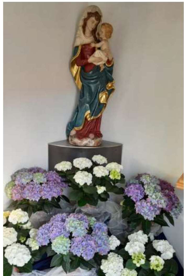
Maialtar 2025: Foto: Gerda Wagner