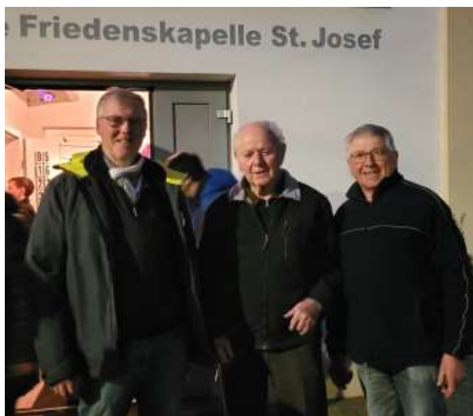
Drei Josefs beim Gottesdienst zum Patrozinium in der Friedenskapelle am 21. März.