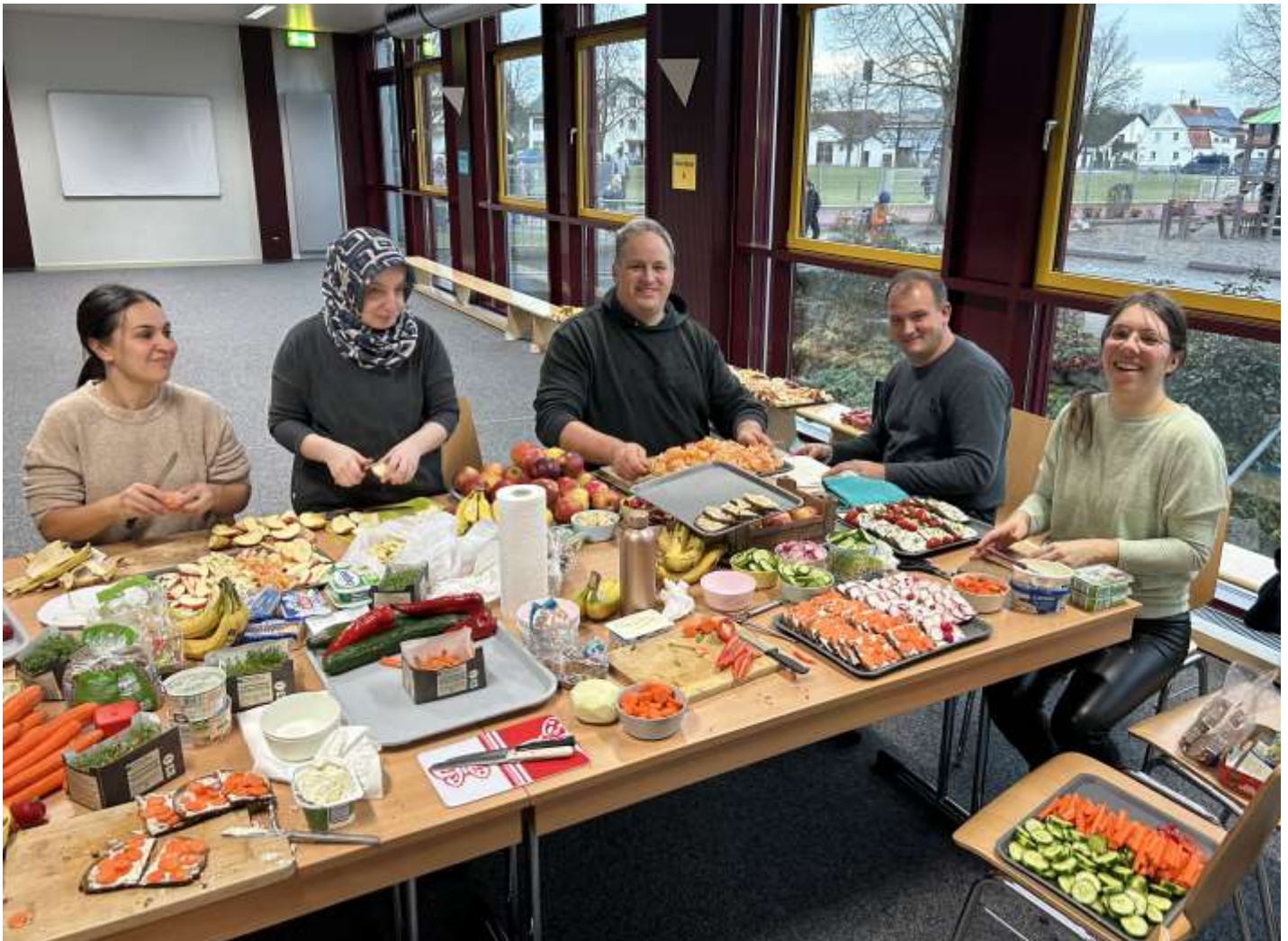
Text und Fotos: Grundschule Untermeitingen