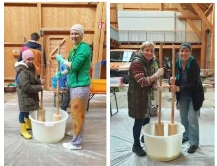
Text und Fotos: Robert Jacob