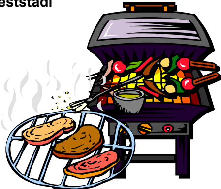
Vignette: Print Artist Privat

Am: Freitag, 19.07.2024 Um: ab 18.00 Uhr Wo: Feststadl