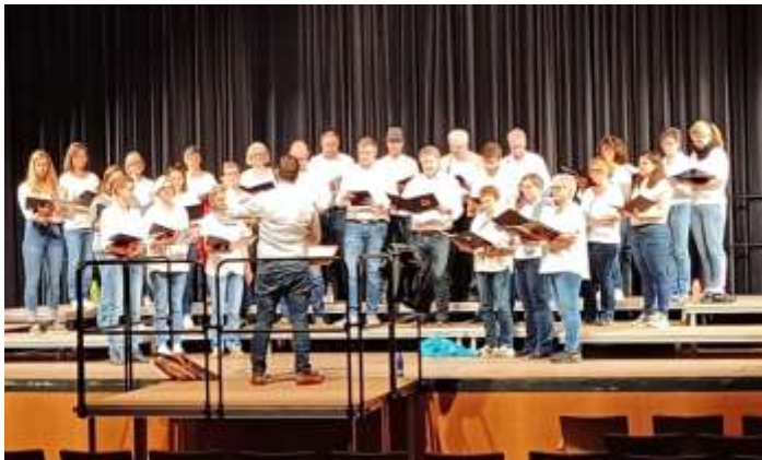
Choraufstellung bei „Sing dein Bestes“ in Waldkraiburg

„Sing dein Bestes“ war das Motto, unter dem sich acht Chöre zu einer großartigen Veranstaltung im Haus der Kultur in Waldkraiburg trafen. Eingeladen hatte der Bayerische Sängerbund zu diesem Wertungs- und Begegnungssingen Chöre aus ganz Bayern.