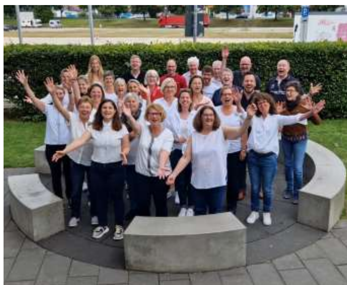
Gesangverein „Fröhlichkeit“

Für's leibliche Wohl ist durch die kulinarischen Künste unserer Chorleit' gesorgt. Unsere Sänger*innen versorgen Sie dieses Jahr mit musikalischen Schmankerln aus Österreich, Bayern sowie bekannten Pop-Hits.