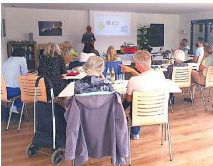
Beim Tabletkurs der Nachbarschaftshilfe erfuhren die Teilnehmer die Grundlagen für die Nutzung eines Tablets.

Der zweitägige Tabletkurs für Neueinsteiger, den die Nachbarschaftshilfe „Wir daheim auf dem Lechfeld“ in Untermeitingen angeboten hat, war mit neun Teilnehmenden wieder ausgebucht.