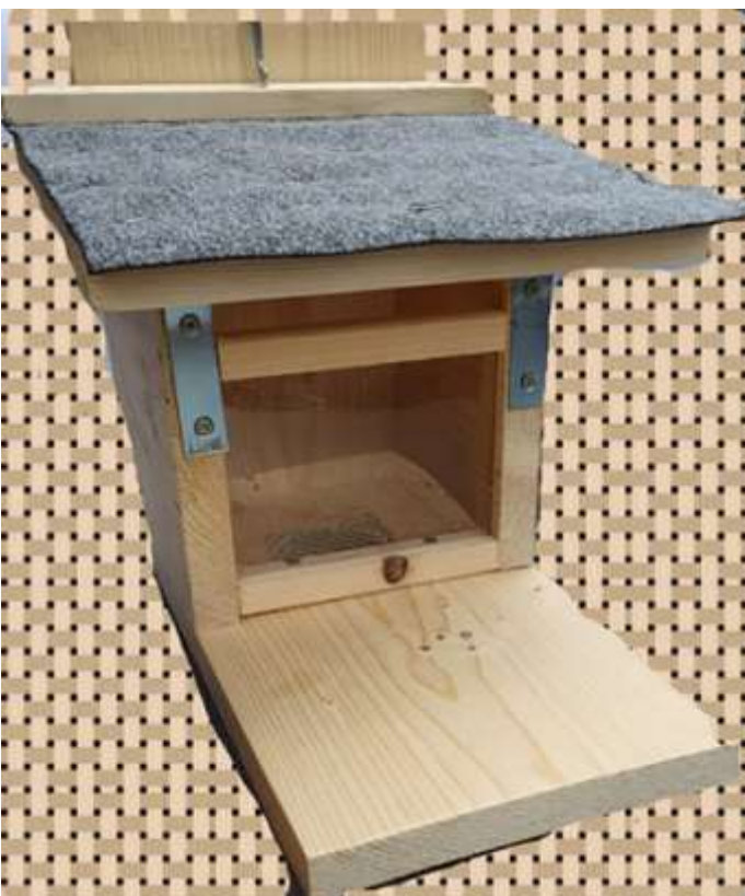
Futterhäuschen für kleine Nager