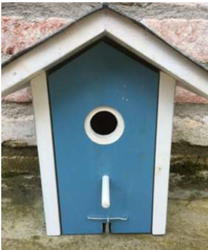
Die von unserer Jugend selbstgemachten Nistkästen können Sie auch käuflich erwerben.