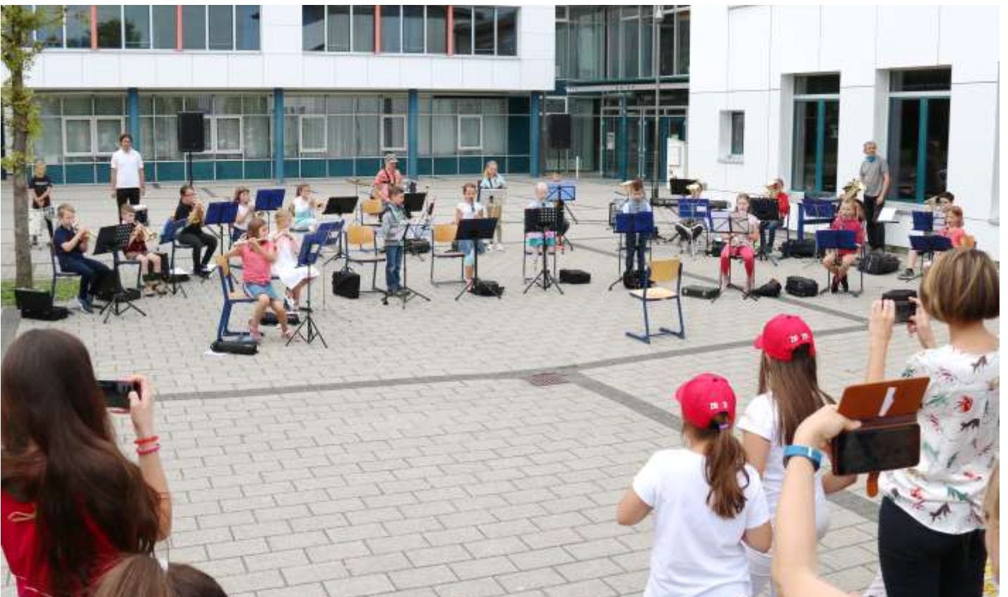
Junge Künstler der Musikschule Lechfeld