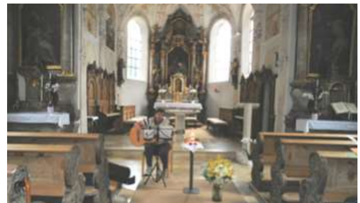
Text und Foto: Brigitte Rid

Mütter beten für Kinder Seit vielen Jahren treffen sich Frauen/Mütter/Großmütter jeden 1. Dienstag im Monat um 10.00 Uhr zum Gebet in der Kapelle. Nach einer Corona bedingten Pause, jetzt in der Pfarrkirche Obermeitingen. Vorbereitet und musikalisch begleitet wird die Gebetsstunde von Charlotte Both. Nächstes Treffen geplant für 6. Oktober nach bis dahin gültigen Regeln in der Kirche oder Kapelle.