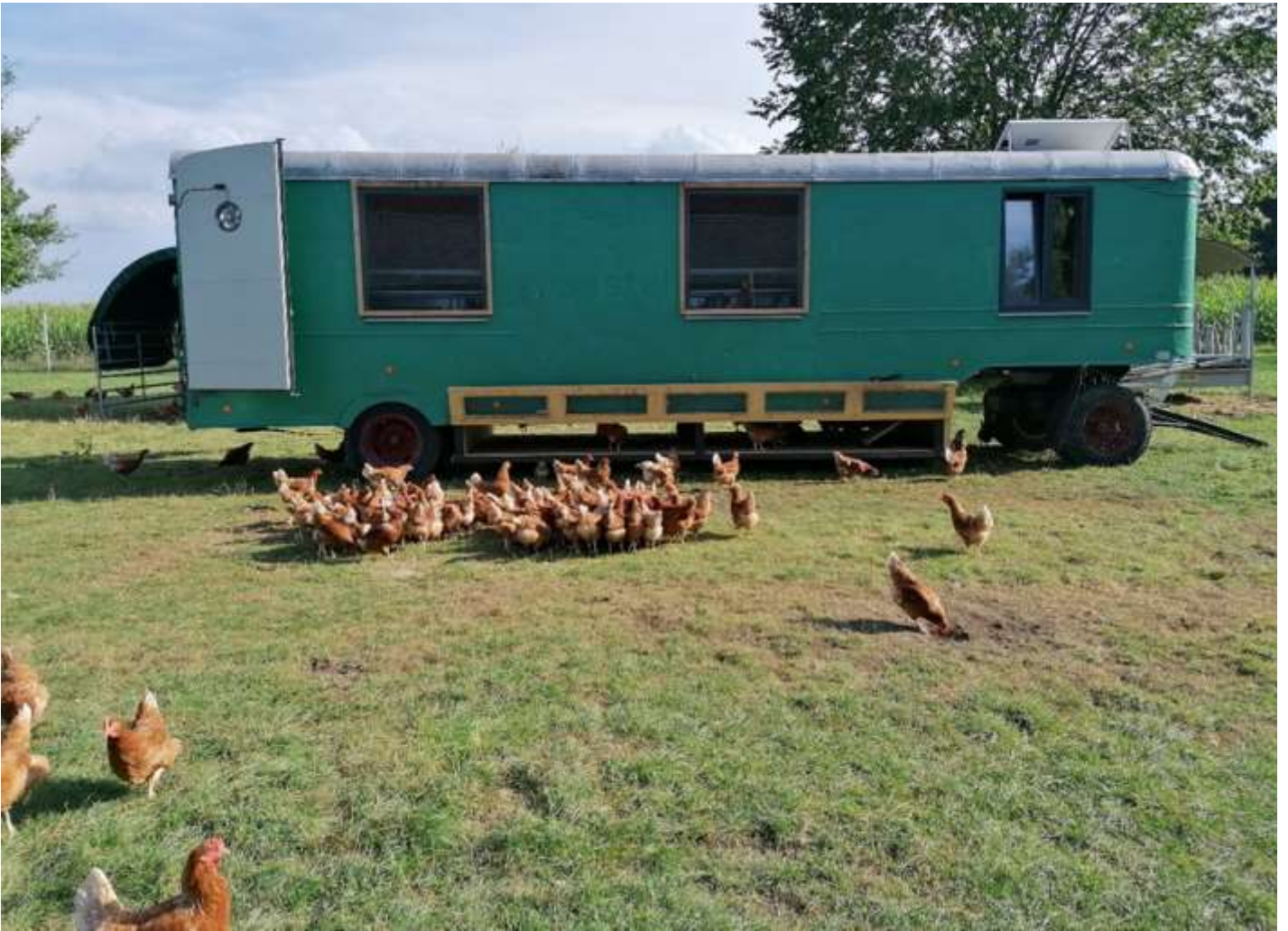
Der selbstgebaute Hühnerwagen der Familie Kuhn