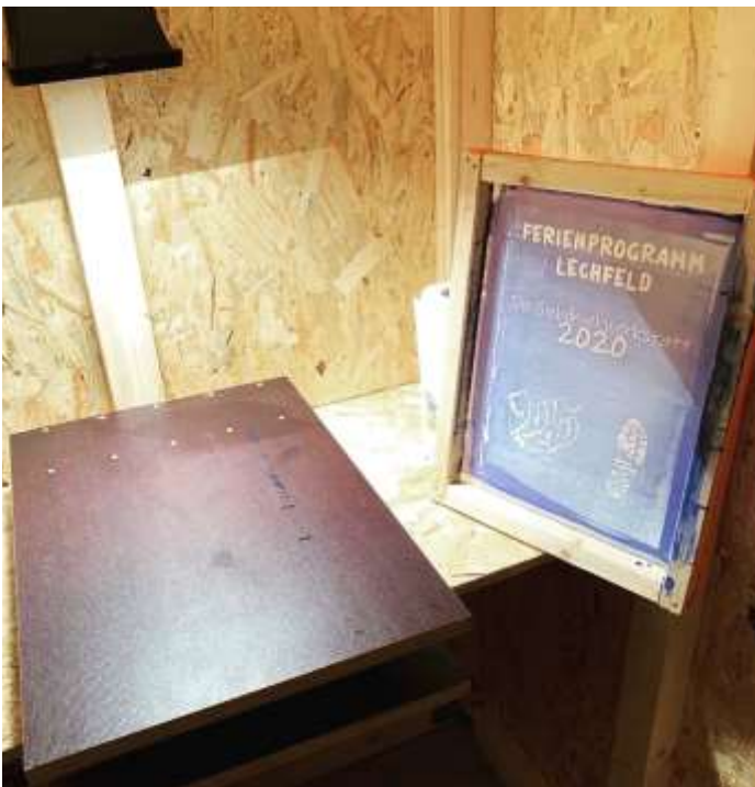
Siebdruckwerkstatt im Jugendhaus Untermeitingen

Ihr habt Lust, eigene „Brands“ zu kreieren? Ihr wollt euch durch individuelle Shirts als Team, Verein oder als Freundeskreis kennzeichnen? Ihr wolltet schon immer wissen, wie Siebdruck funktioniert? Kein Problem: Wir begleiten euch von der Erstellung eurer Siebe bis hin zum fertigen Druck!