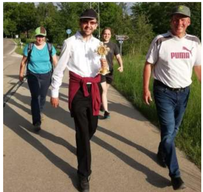
Die jährliche Klimmach-Wallfahrt geht zurück auf ein Gelübde von 1836 aufgrund einer schlimmen Viehseuche.