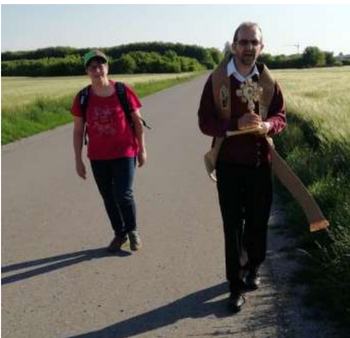
Auf dem Weg nach Klosterlechfeld