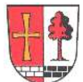
Erwin Losert Erster Bürgermeister