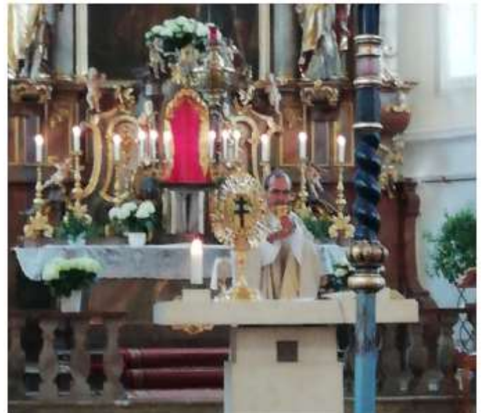
Hl. Messe in der Klimmacher Pfarrkirche Mater Dolorosa

Den Gottesdienstanzeiger, mit Hinweisen in welchen Kirchen wieder Hl. Messen stattfinden können und welche Live-Stream-Angebote bestehen, können Sie unter www.katholisch-lechfeld.de unter „Gottesdienste“ abfragen