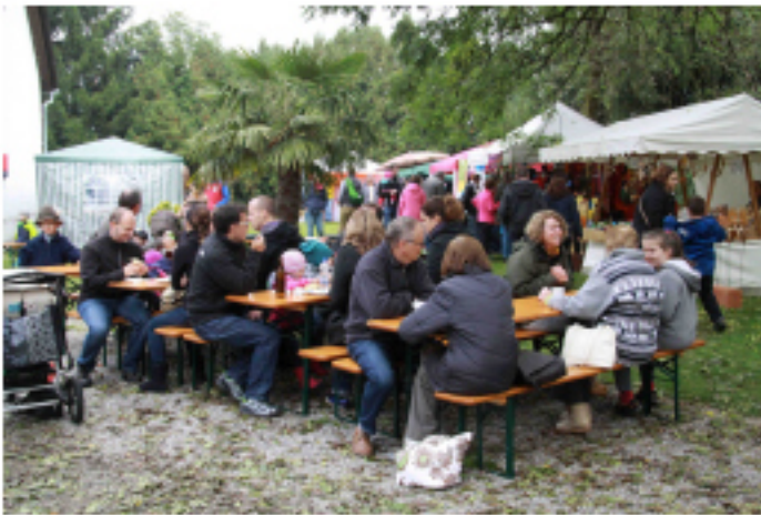
Die Bierbänke waren schnell besetzt

Die Sparkasse Landsberg-Dießen unterstreicht mit ihrem Engagement erneut ihre Verantwortung für die Menschen in der Region.