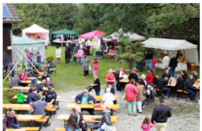
Zahlreiche Stände zeigten ihre vielseitigen Angebote