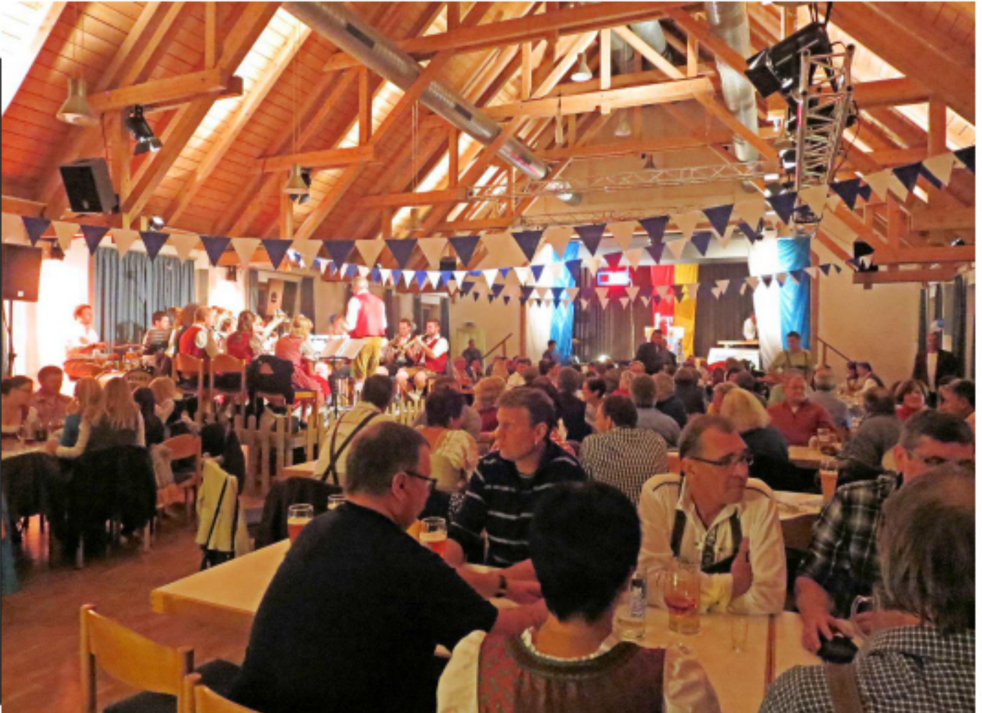
Oktoberfest im Bürgerhaussaal