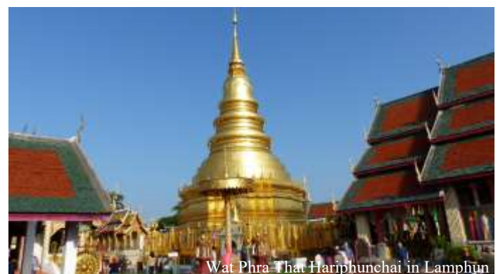
Wat Phra That Hariphunchai in Lamphun