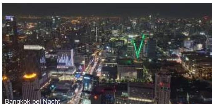
Bangkok bei Nacht