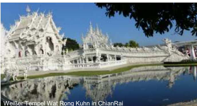
Weißer Tempel Wat Rong Kuhn in Chian Rai