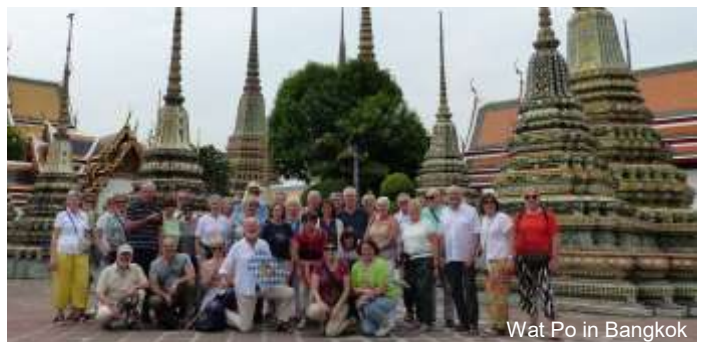
Wat Po in Bangkok