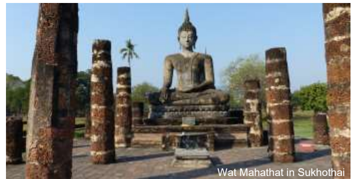
Wat Mahathat in Sukhothai