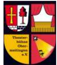
Simone Hartwig

*Zur Premiere laden wir auf einen Sekt und Orangensaft ein