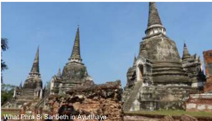
What Phra Si Sanbeth in Ayutthaya