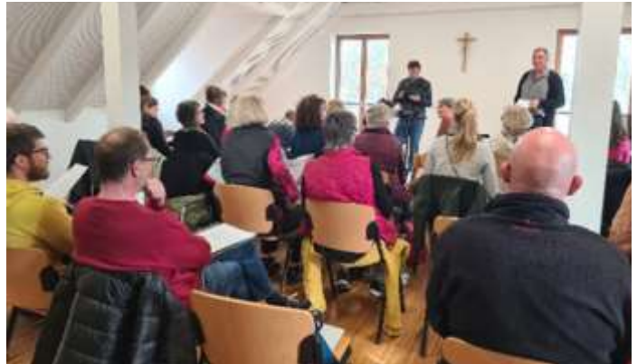
Konzentriert bei der Sache!

Viele spannende und wohlklingende Stücke stehen Ihnen bevor!