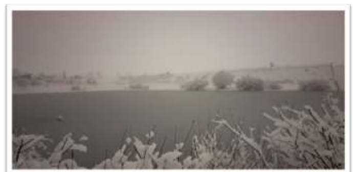
Text und Fotos: Günther Naßl