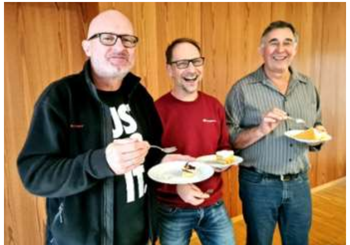
Stärkung muss sein! Unsere Herren bei der Kuchenpause.