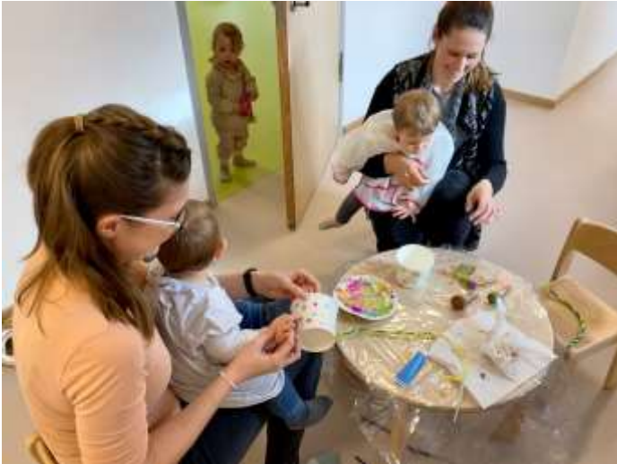
Die Kleinsten basteln Osterkörbchen