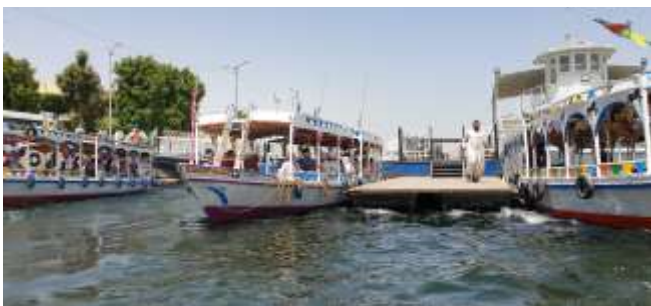
Auf dem Nil