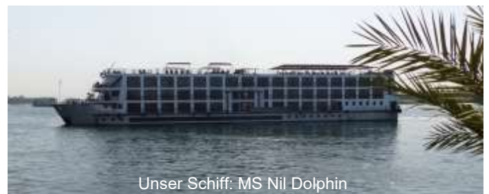
Unser Schiff: MS Nil Dolphin