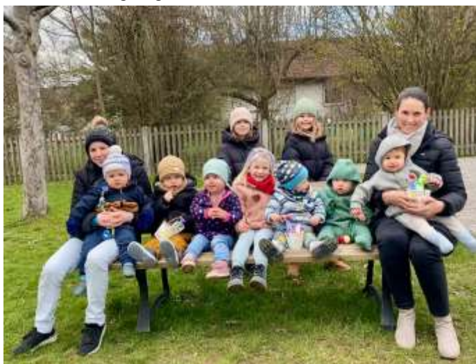
Herzlichen Dank für die Spende der Gemeinde! Die Kinder haben sich sehr gefreut.

Unsere Krabbelgruppe hat in der Zwischenzeit sehr großen Zuspruch erfahren, so dass wir seit März zwei offene Krabbelgruppen in Obermeitingen, zum einen für die unter 1-jährigen Kinder und die Gruppe über 1 Jahr, führen. Beide Gruppen treffen sich in der Turnhalle über der Feuerwehr.