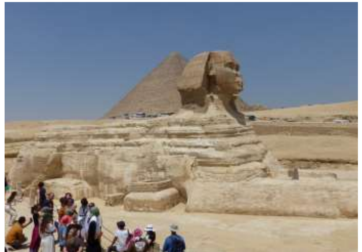
Große Sphinx von Gizeh, im Hintergrund die Pyramide des Cheops