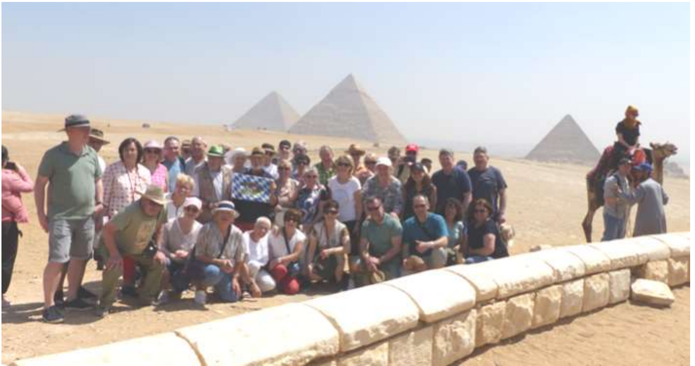
Vor den Pyramiden von Gizeh