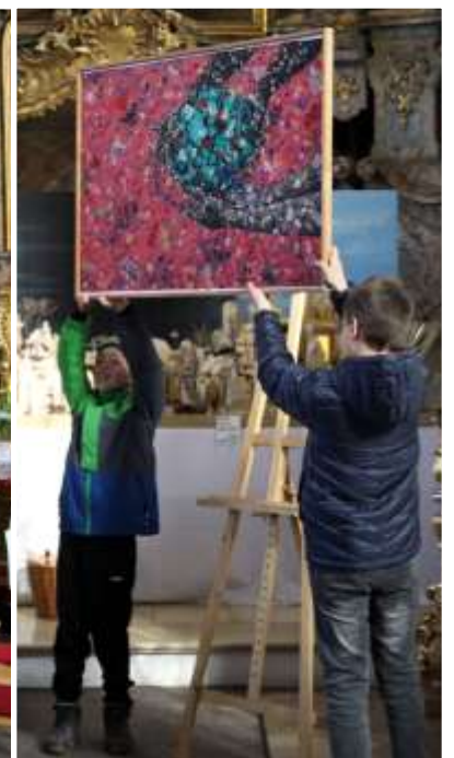
Zu einem der Musikstücke zeigten Jugendliche das Bild vom diesjährigen Misereor-Fastentuch.