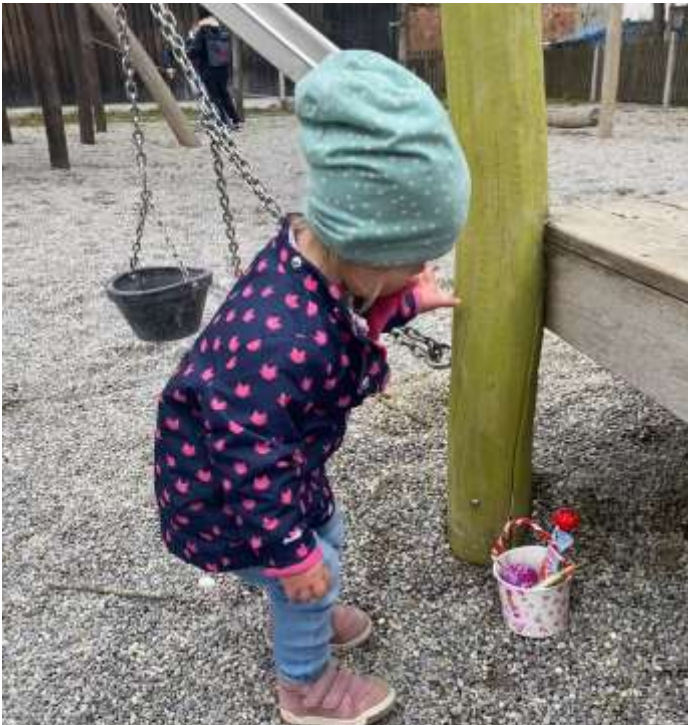
Ostereiersuche! Der Hase hat uns doch tatsächlich `was ins Körbchen gelegt...