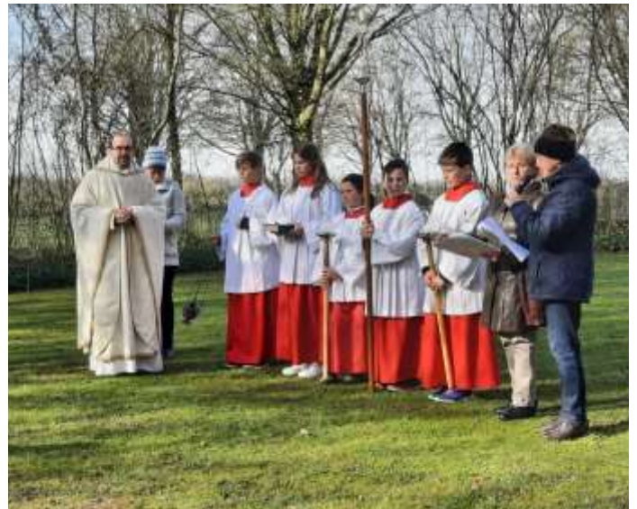
Emmausgang am Ostermontag