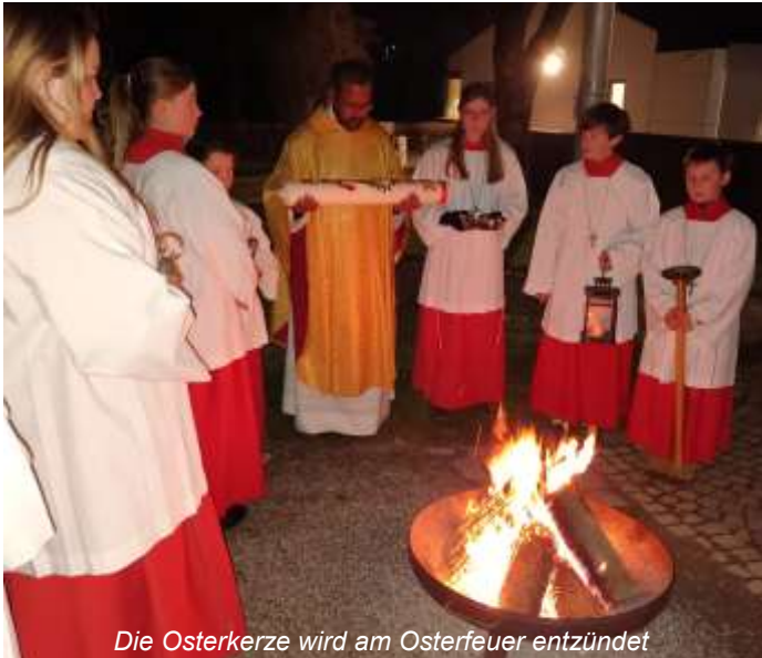
Die Osterkerze wird am Osterfeuer entzündet