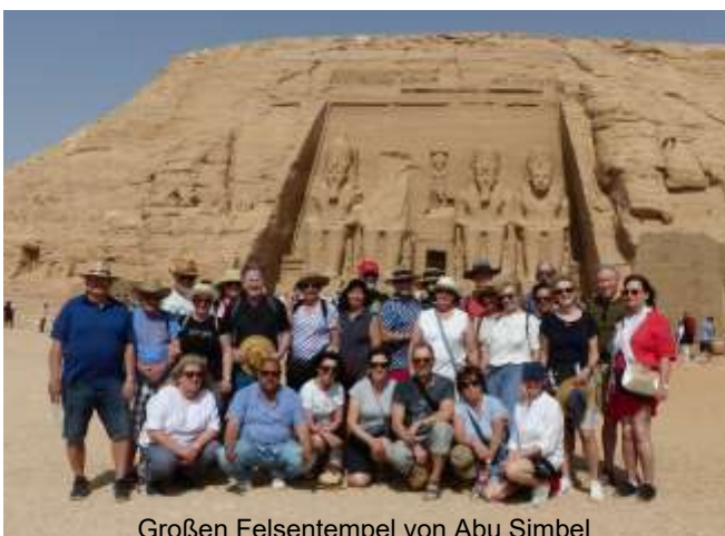
Großen Felsentempel von Abu Simbel