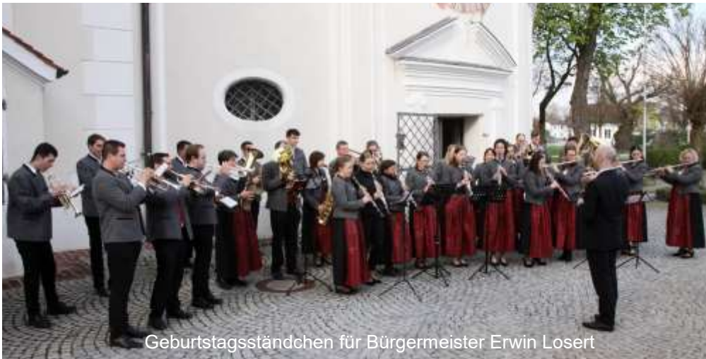
Geburtstagsständchen für Bürgermeister Erwin Losert