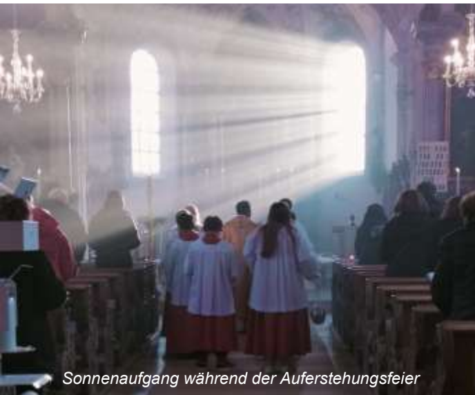
Sonnenaufgang während der Auferstehungsfeier