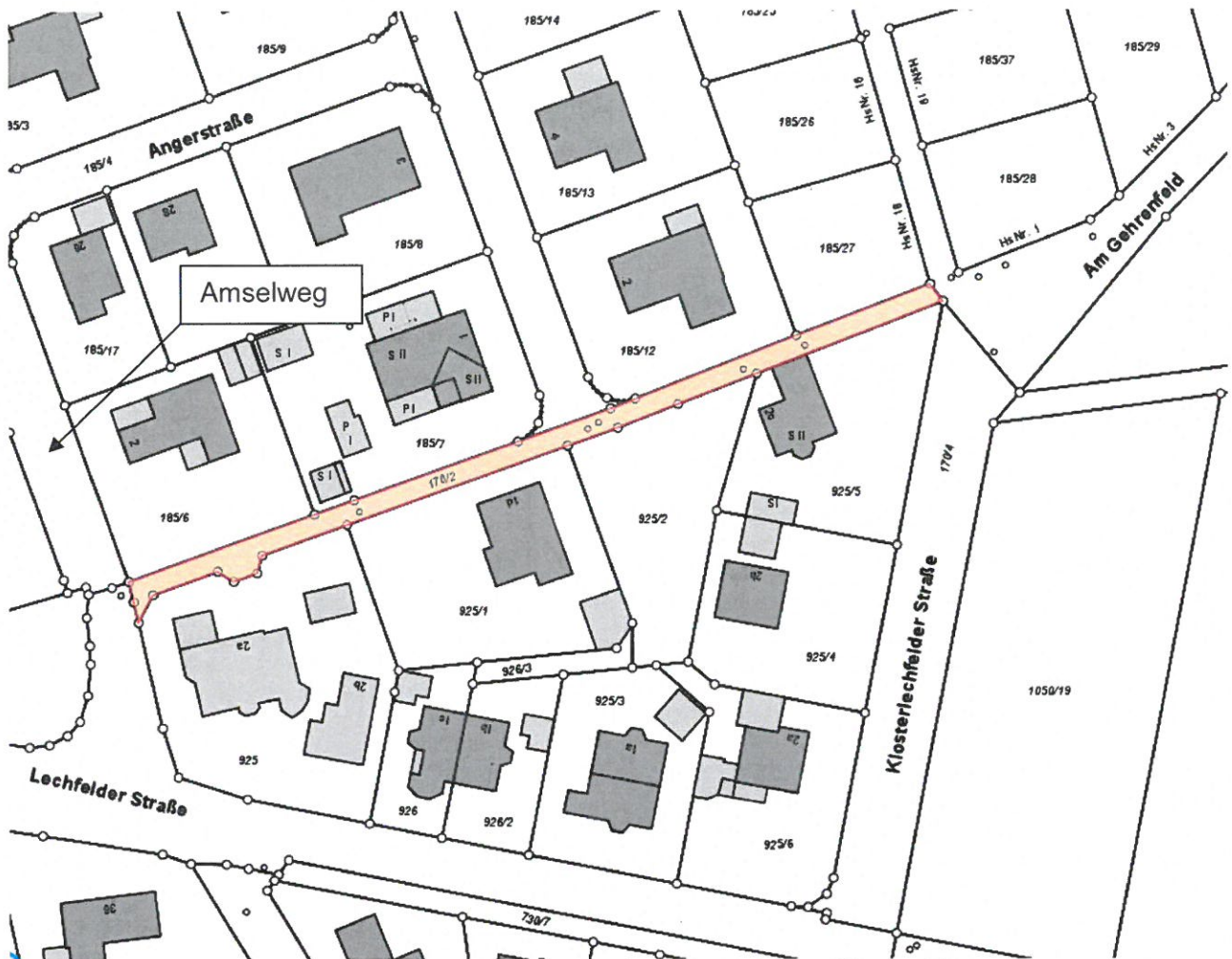
Abb. 1 – Zu widmender Weg mit der Flur-Nr.: 170/2 – Gemarkung Obermeitingen