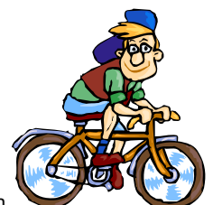
Vignette: Print Artist / Privat / Verein

13.45 Uhr: Freitags-Radeln Radfahrverein, TP: Steingadener Str. 16.