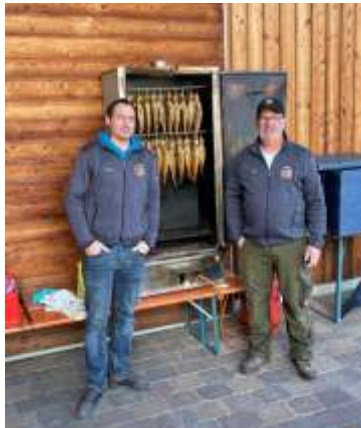
Euer Fischereiverein Obermeitingen Text und Fotos: Günther Naßl