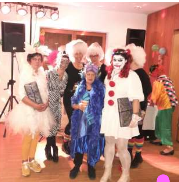
Die Siegerinnen der Maskenprämierung