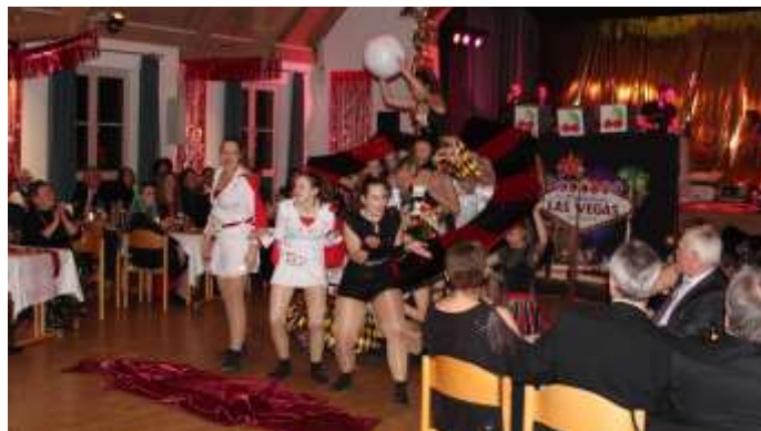
Mittelstetter Faschingsclub - MFC OLÉ!