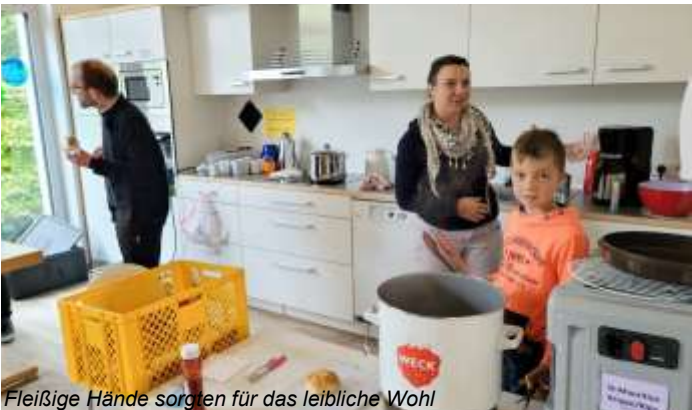
Fleißige Hände sorgen für das leibliche Wohl