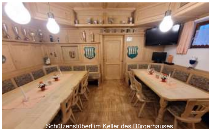
Schützenstüberl im Keller des Bürgerhauses