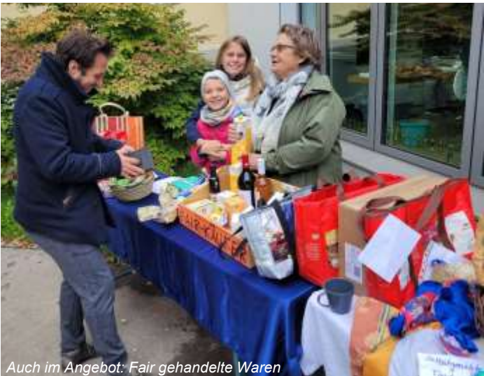
Auch im Angebot: Fair gehandelte Waren