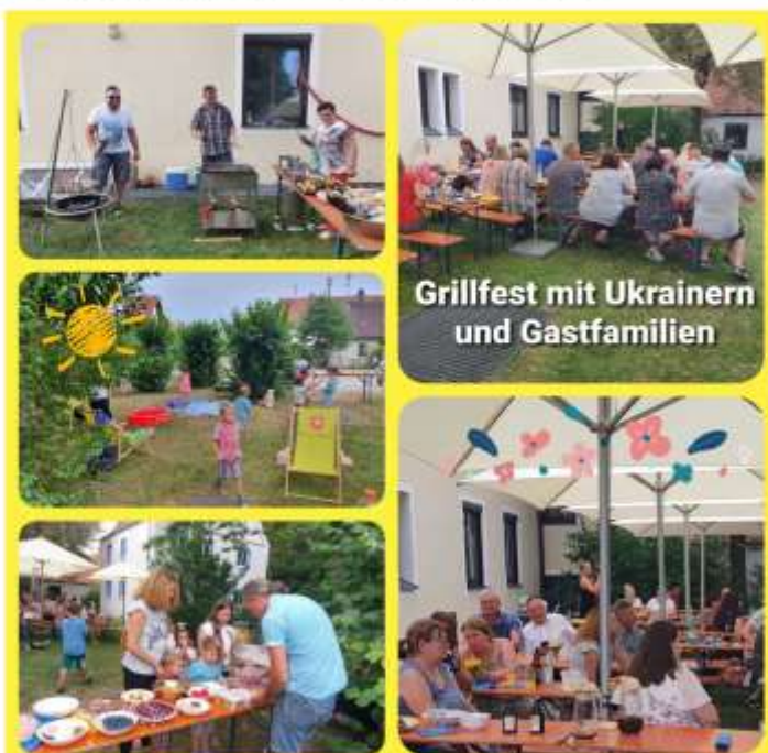
Grillfest mit Ukrainern und Gastfamilien

Die vielen Flüchtlingshelfer, die im Lechpark (Kleider-, Spielzeug- und Sachspendenausgabe), bei den Aktionen (Zirkusbesuch, Willkommens-Café, Picknick, Grillen), beim Dolmetschen (Anträge, Arztbesuche) sowie bei den Fahrten unterstützt haben und die zahlreichen Spenden (z.B. in Form von Gutscheinen) sind Zeichen der großen Anteilnahme. Vielen herzlichen Dank.