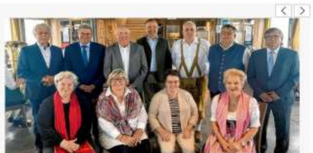
Text und Foto: Gerald Modlinger

Am 1. Juli 1972 entsteht der Landkreis Landsberg in seiner heutigen Form. Bei einer Schifffahrt auf dem Ammersee wird daran erinnert. Der Halbtagesausflug bildet auch den Rahmen, um verdiente Kommunalpolitiker zu ehren.