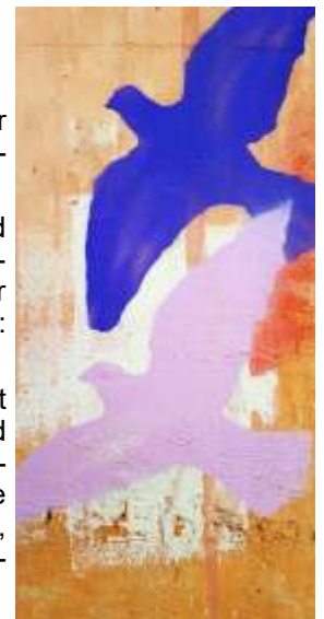
Bild: Unbekannter Künstler (Bild, Detail)