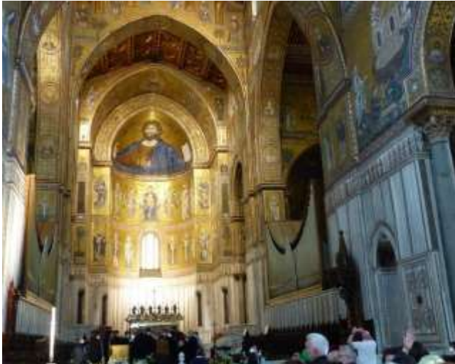
Kathedrale von Monreale