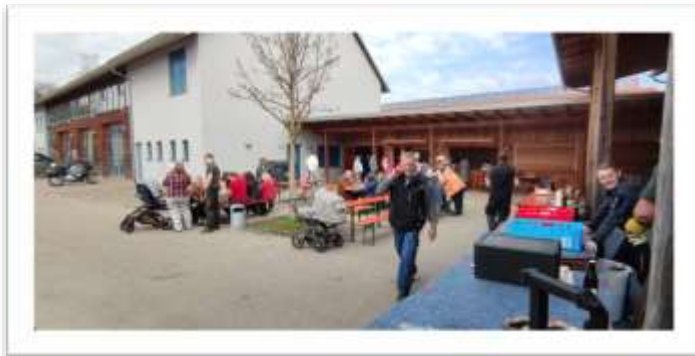
Euer Fischereiverein Obermeitingen Text und Fotos: Günther Naßl

Am 18.März wurde der Maibaum gefällt, noch im Wald geschäftsgert und am 22. April aus Schwabmünchen ins Dorf geholt.