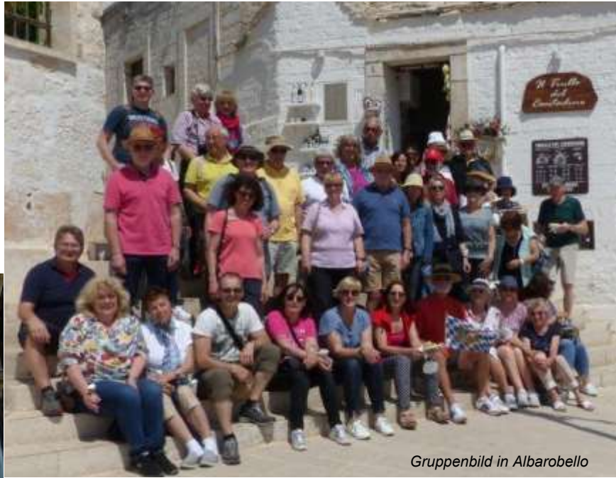
Gruppenbild in Albarobello