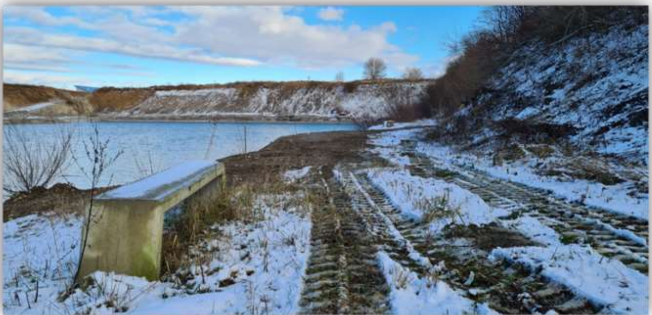
Euer Fischereiverein Obermeitingen Text und Bilder: Günther Naßl