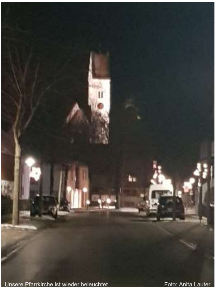
Unsere Pfarrkirche ist wieder beleuchtet