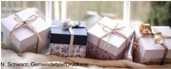
N. Schwarz, GemeindebriefDruckerei