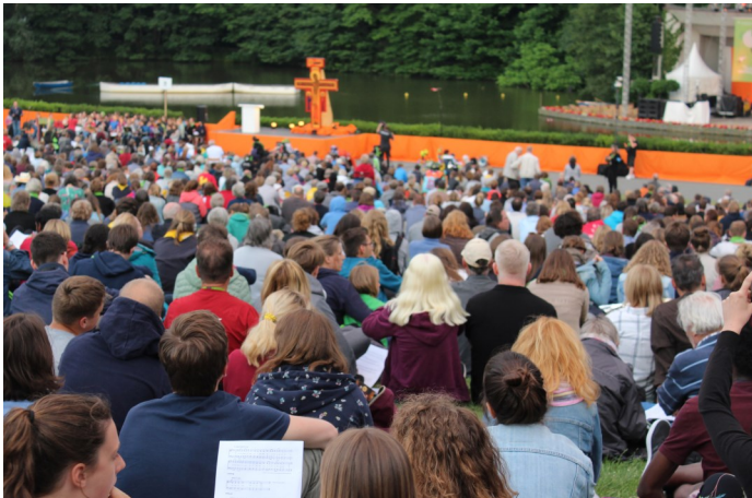
Open Air in Taizé - Gottesdienst beim Evangelischen Kirchentag 2019.