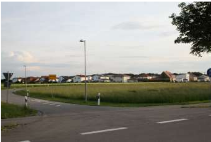
Das Foto zeigt den Bereich, wo das neue Baugebiet Süd VI geplant ist

„Uns erreichen täglich Anfragen zu Bauplätzen. Wir müssen ein entsprechendes Angebot schaffen, das für junge Familien erschwinglich ist“, berichtete Obermeitingens Bürgermeister Erwin Losert (CSU) in der jüngsten Gemeinderatssitzung. Aus diesem Grunde plant die Gemeinde ein neues Baugebiet. Unter der Bezeichnung „Süd VI“ soll es am östlichen Ortseingang zwischen der Lechfelder Straße und der Aggensteinstraße ausgewiesen werden. Dort, wo in der Vergangenheit große Veranstaltungen, wie das Bezirksmusikfest und das Traktorpulling, stattfanden, möchte die Gemeinde auf 9300 Quadratmetern zehn bis elf Bauplätze anbieten. Um das Vorhaben auf den Weg zu bringen, beschloss der Gemeinderat die siebte Änderung des Flächennutzungsplans der Gemeinde und die Aufstellung eines Bebauungsplans. Den Auftrag für alle Planungen rund um das neue Baugebiet erhält das Ingenieurbüro MOD-PLAN aus Marktberdorf.