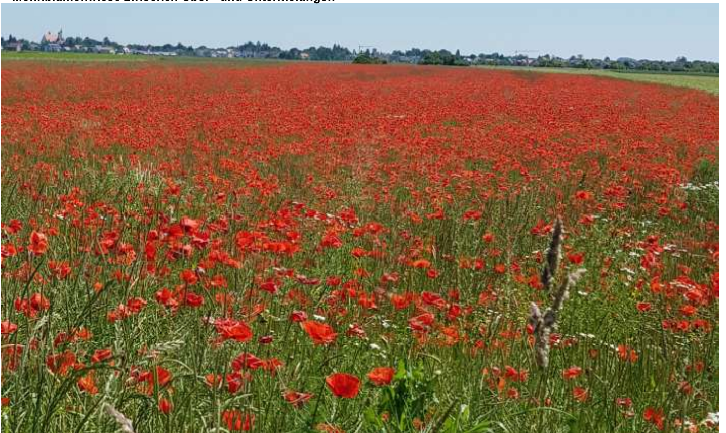
Mohnblumenwiese zwischen Ober- und Untermeitingen