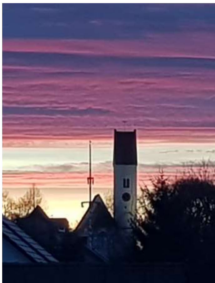
Eindrucksvolles Farbenspiel über St. Mauritius im März beim Sonnenuntergang.

Geplante Evang. Gottesdienste in der OM-Kapelle (sofern möglich – bitte dazu aktuellen Aushang am Rathaus beachten): 28. März und 25. April 2021.