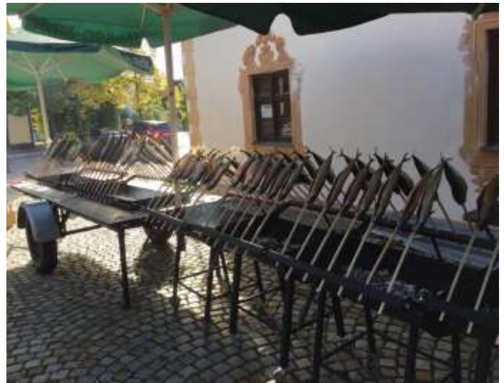
Text und Fotos: Susanne Mayr

Ihre Natur und Angelfreunde Lechfeld e.V.