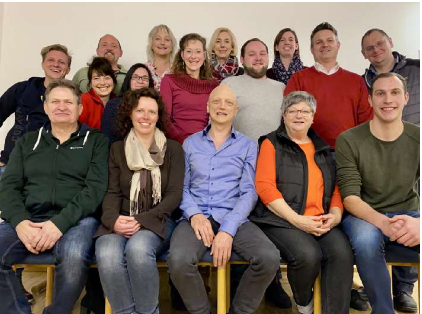
Die Vorstandschaft und die aktuellen Spieler der Theaterbühne Obermeitingen e.V.