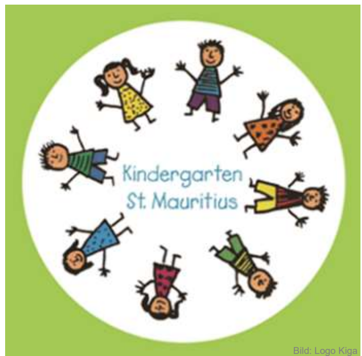
Bild: Logo Kiga

Sie möchten für Ihr Kind einen Platz in einer unserer Krippen- oder Kindergartengruppen?