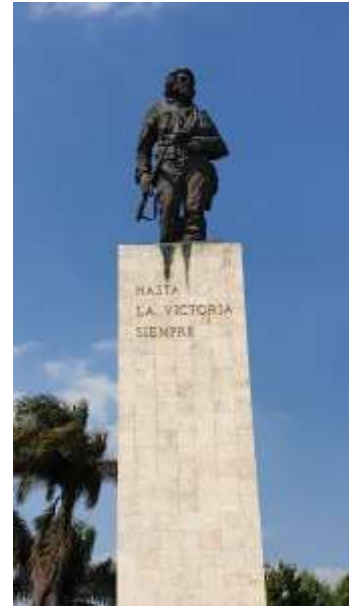
Santa Clara - Che Guevara Mausoleum