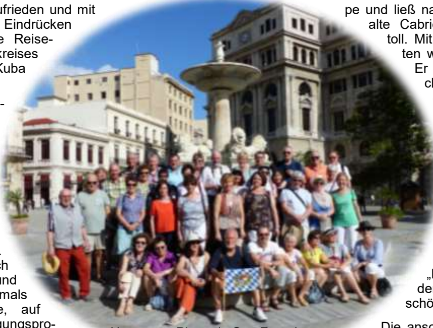
Havanna - Plaza de San Francisco

Für große Freude sorgte der Reiseleiter in Havanna. Er organisierte eine Stadtrundfahrt in Oldtimern für die Grup-