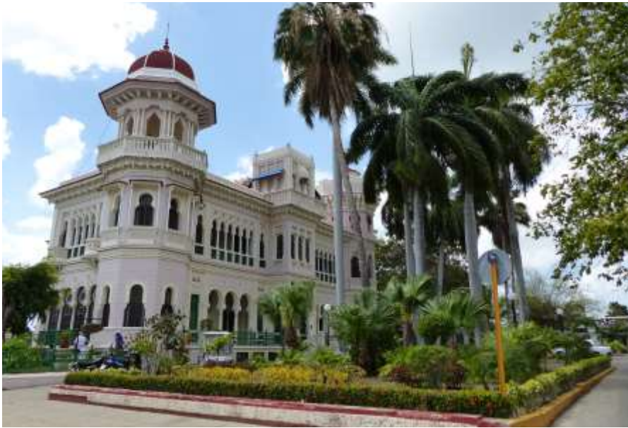
Palacio de Valle in Cienfuegos