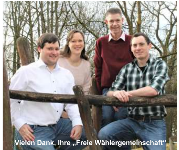
Vielen Dank, Ihre „Freie Wählergemeinschaft“