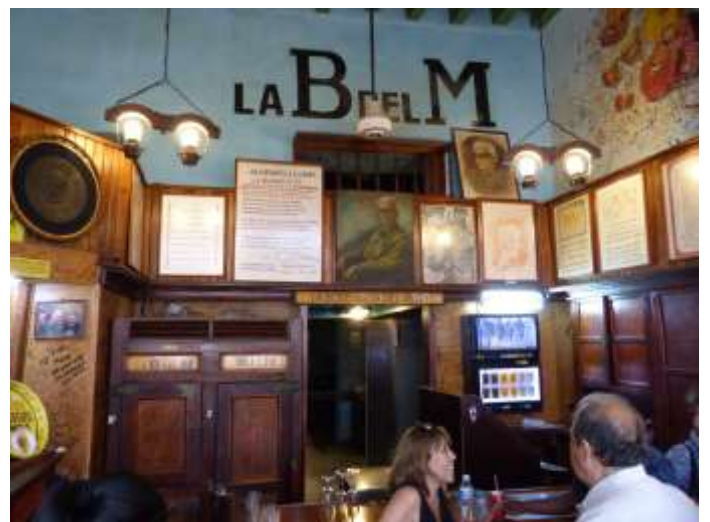
Geburtsort des Drinks „Mojito“