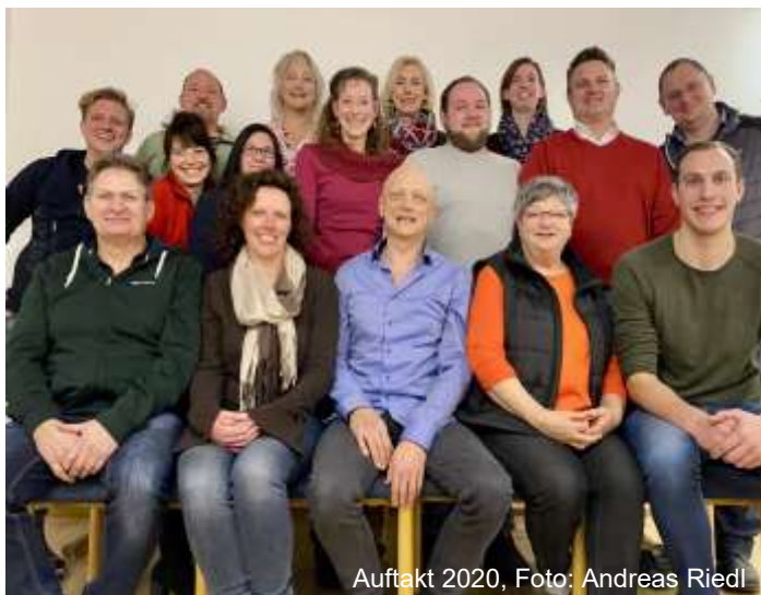
Auftakt 2020, Foto: Andreas Riedl

Weitere Details zum Verein unter http://theaterverein-obermeitingen.de/ abrufbar.