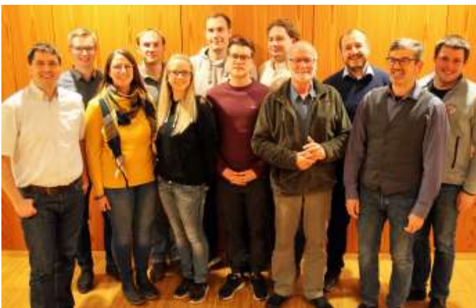
Mit diesen zwölf Kandidaten für den Gemeinderat tritt die Unabhängige Bürgerliste-Obermeitingen zur Kommunalwahl am 15. März an. Bisher hatte sie vier Sitze im Obermeitingen Gemeinderat.

Zwölf Bürger im Alter von Anfang 20 bis Mitte 60, darunter zwei Frauen, wurden nominiert und treten nun bei der Kommunalwahl am 15. März für die UBL-Obermeitingen an.