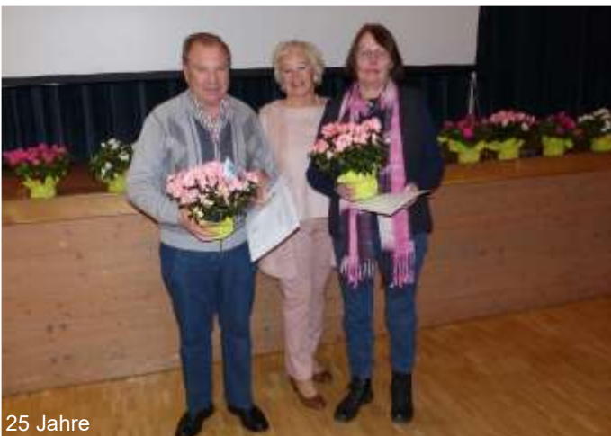
Text und Fotos: Robert Jacob