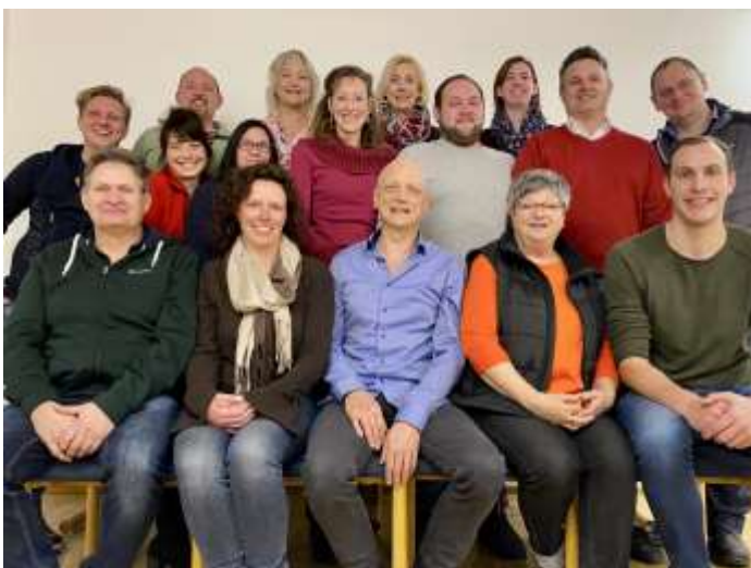
Auftakt 2020, Foto: Andreas Riedl

Weitere Details zum Verein unter http://theaterverein-obermeitingen.de/ abrufbar.