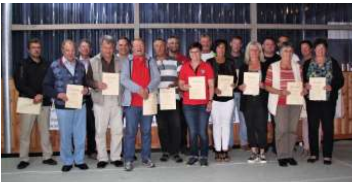
Diese Mitglieder des SSV Obermeitingen wurden für 25- und 50-jährige Vereinstreue geehrt.

Liebe Obermeitingen, Liebe Sportfreunde,