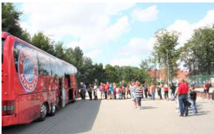
Warteschlangen bildeten sich bei der Besichtigung des FC-Bayern Busses