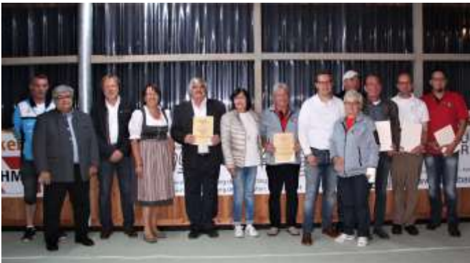
Mit Verdienstnadeln und Urkunden des Bayerischen Landes- sportverbandes wurden diese langjährig ehrenamtlich tätigen Funktionsträger des Vereins ausgezeichnet