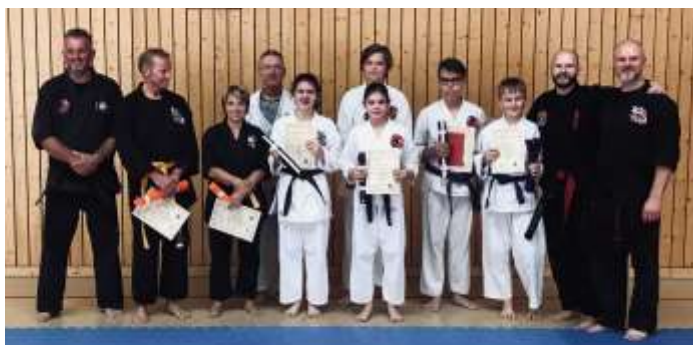
Prüflinge Ryukyu Kempo Karate

Für alle, die Fitness, Motorik und Kondition auf ein neues Level bringen wollen, und denen die Sicherheit der Familie am Herzen liegt: Ab 10.09.2019 finden ab 17.00 Uhr neue Einsteigerkurse für Kinder und Erwachsene statt! Und auch für die Kleinsten (ab 5 Jahren) gibt es ab dem 13.09.2019 die Möglichkeit, bei uns rein zu schnuppern!