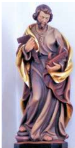
Der „Hl. Josef“ in der Kapelle