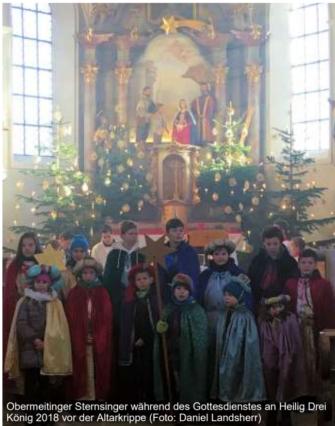
Obermeitinger Sternsinger während des Gottesdienstes an Heilig Drei König 2018 vor der Altarkrippe