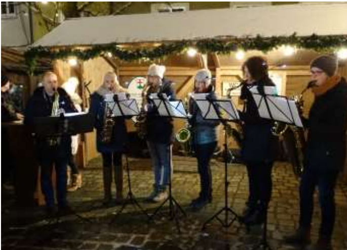
Text und Foto: Vanessa Waldheim

Am 17. Dezember spielte das Saxophon-Quintett auf dem Landsberger Christkindlesmarkt. Mit einer Auswahl an klassischen und modernen Weihnachtsliedern zeigte sich das Register und präsentierte den Musikverein Obermeitingen.