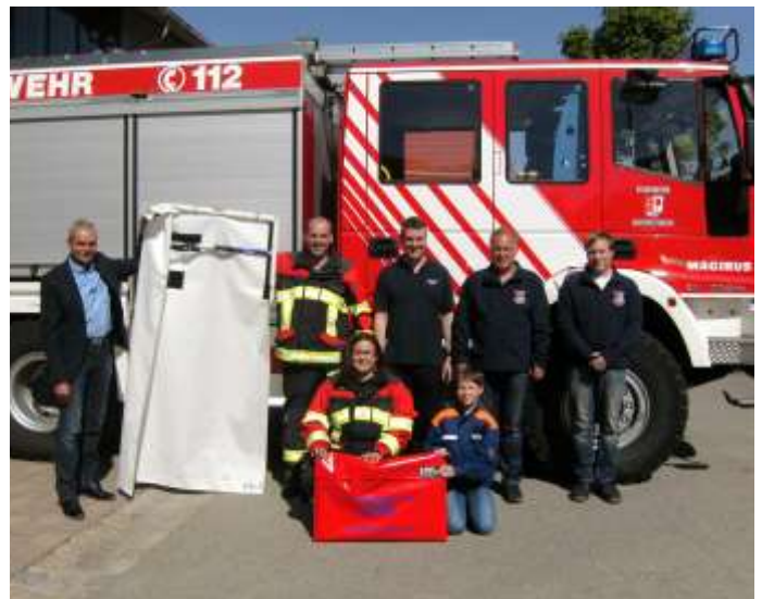
Bild: Übergabe Rauchvorhang

Sein Einsatzgebiet ist an der Eingangstüre im Treppenhaus, um eine Rauchbarriere zwischen der betroffenen Wohnung und dem restlichen Gebäude zu schaffen. Dieser soll den Rest des Gebäudes vor Rauchausbreitung und Rauchschäden schützen.