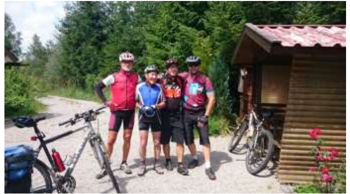
Text und Fotos: Günther Schreiner