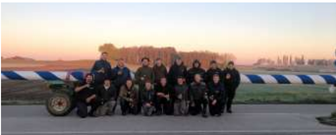
Die Maibaumdiebe

In der Nacht vom 29. April auf den 30. April gelang uns dann der Clou, in das von den Medien als Fort Knox bezeichnete Lager des Landsberger Maibaums hineinzukommen. Nun musste es schnell gehen, innerhalb weniger Stunden mussten genug Leute aufgetrieben werden, um den Baum von den Landsbergern zu entwenden. 18 Mann unseres Burschenvereins erklärten sich bereit dazu, mitzuhelfen, den Baum sicher nach Hause zu bringen. Sie brachten den Baumwagen in Stellung, öffneten die Tore der Feuerwehr, verschoben einige der vor dem Baum abgestellten Fahrzeuge und holten den Baum letztendlich aus der Landsberger Feuerwehrhalle. Als Auslöse wurden 150 Liter Bier und eine Spansau ausgehandelt.