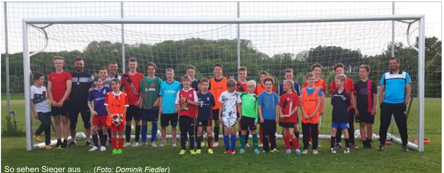
So sehen Sieger aus ...