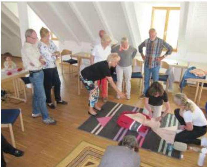
Die 17 Kursteilnehmer konnten dann selbst an zwei Versuchspuppen den Druckpunkt feststellen und mit der Reanimation beginnen.