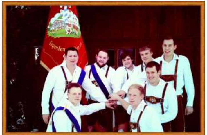
Die Vorstandschaft des Burschenvereins

Die im Januar neu gewählte Vorstandschaft fand sich gut in die Tätigkeiten ein. Das Vereinsjahr startete gleich mit einer Skifahrt nach Kaprun, der Teilnahme an vier Faschingsumzügen mit dem diesjährigen Motto: „Panzerknacker“ sowie der Aktion: „Saubere Landschaft“.