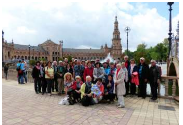
Die Reisegruppe in Sevilla auf dem Plaza de Espana.