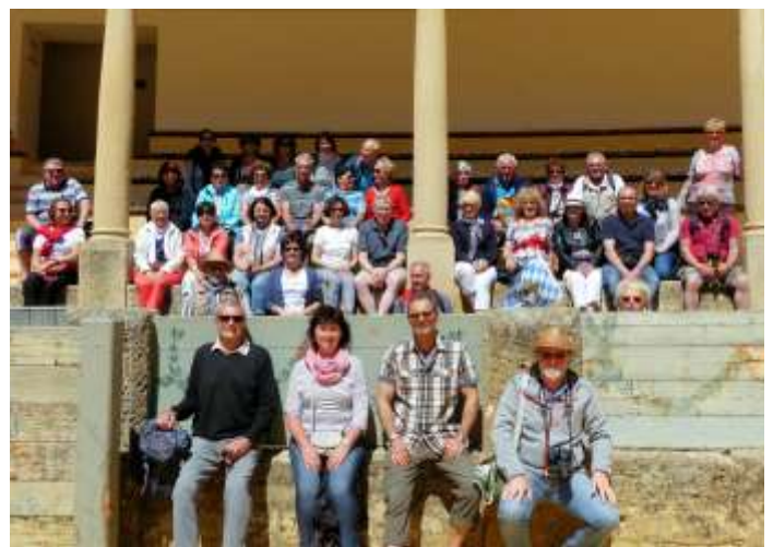
Die Reisegruppe in der ältesten Stierkampf-Arena Spaniens in Ronda.

Ein ganzer Tag Regen, aber danach nur noch Sonnenschein, das ist Andalusien, die Costa del Sol, wie man es dort erwartet. Die Zeit mit vielen Eindrücken, in bester Harmonie, guter Laune, 1a Verpflegung und Unterbringung, sowie lustigen Abenden ging für die 43 Teilnehmer viel zu schnell vorbei.