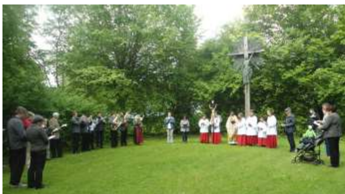
2. Station beim Flurumgang an Christi Himmelfahrt. (Das Kreuz ist der besondere Ort, den sich der Specht für sein Nest ausgesucht hat - siehe letzte Ausgabe Schau mer mol)