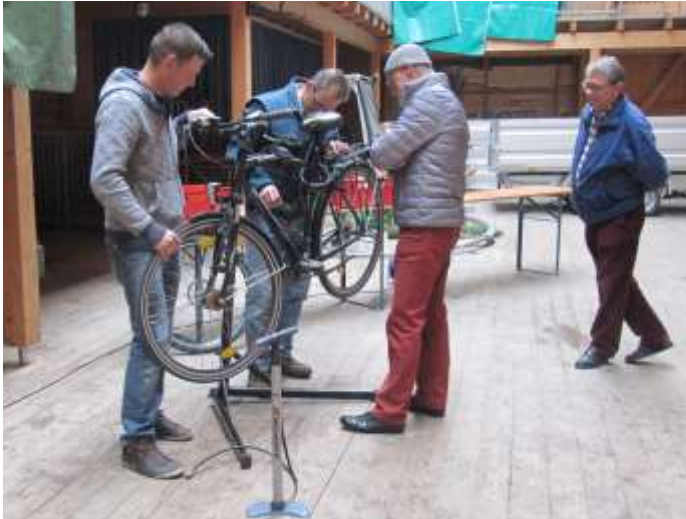
Text und Fotos: Robert Jacob