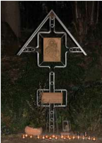
Station am Schönstatt-Bildstöckle