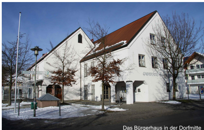
Das Bürgerhaus in der Dorfmitte

In seiner letzten Sitzung des Jahres beschloss der Obermeitingener Gemeinderat, für die weitere Sanierung des Bürgerhauses und des Leichenhauses auf dem Friedhof ein Architekturbüro zu beauftragen.