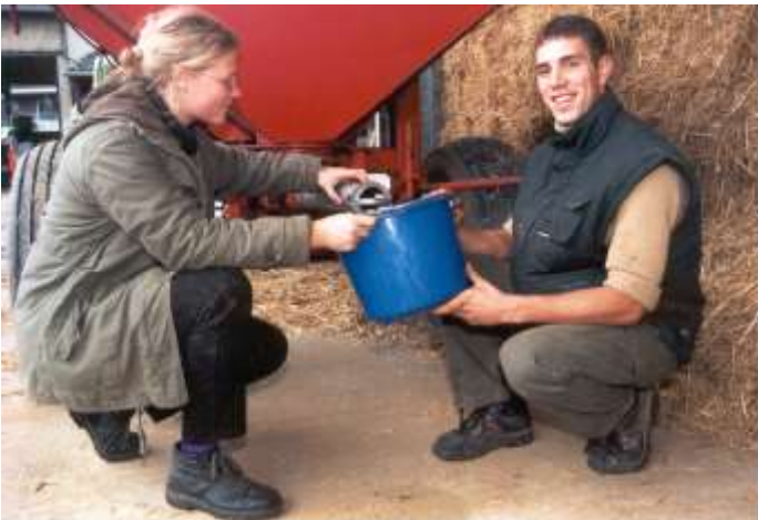
Für Schüler und Studenten in Ferienjobs sind einige Vorschriften zu beachten.

Kinder unter 13 Jahren dürfen nicht beschäftigt werden. Für alle Jugendlichen sind gefährliche Arbeiten, Akkord-, Wochenend- oder Nachtarbeiten verboten. Ab 18 Jahren gelten die genannten Einschränkungen nicht mehr.