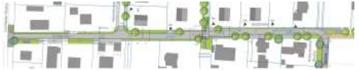
Grafik: Ausbau Südstraße

Um die Situation direkt vor Ort in Augenschein zu nehmen, trafen sich die Räte am 13. April zu einem Ortstermin in der Südstraße und entschieden sich letztendlich mehrheitlich für die Variante ohne Gehweg. Der Gemeinderat stimmte auch gleich der Auftragsvergabe an eine Firma aus Prittriching für den Ausbau sowie für Kanalarbeiten zu.