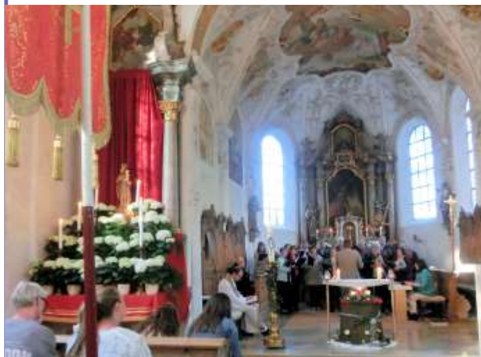
Maiandacht am 08.05.2016 mit dem Singkreis

So 15.05.16 Lagerlechfeld m. d. Chorgemeinschaft GR Mi 18.05.16 Obermeitingen mit Orgelbegleitung So 22.05.16 Untermeitingen mit dem Dreigesang UM Mi 25.05.16 Lagerlechfeld mit Chor und Band St. Martin So 29.05.16 Graben mit dem Chorensemble Graben Di 31.05.16 Klosterlechfeld m. d. Landfrauenchor Augsburg Beginn jeweils 19.00 Uhr.