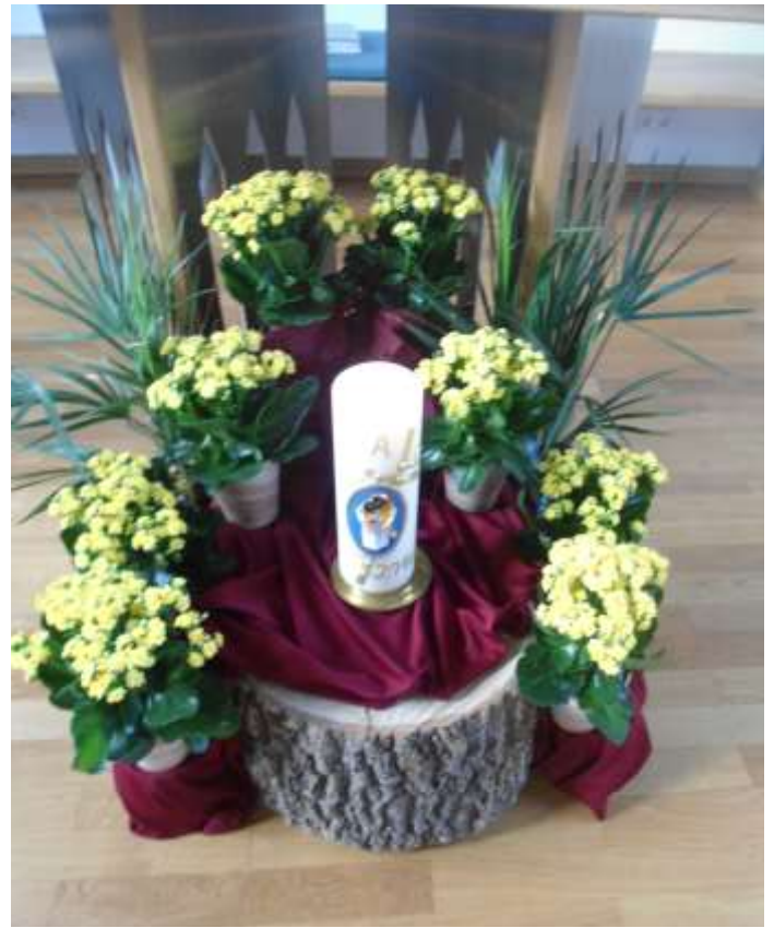
Unsere Kapelle während der Kartage (Grab Jesu) - und jetzt, mit der Osterkerze als Zeichen der Auferstehung, gestaltet von Gerda Wagner, zum Jahr der Barmherzigkeit.