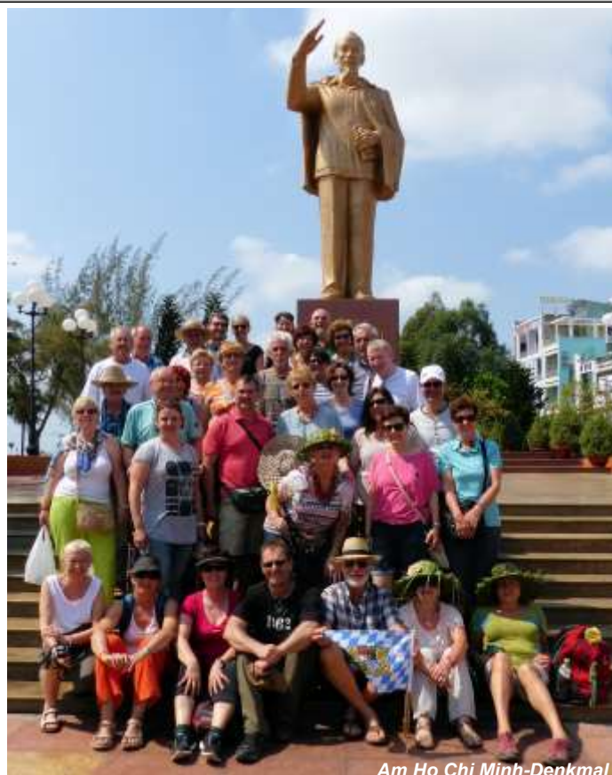
Am Ho Chi Minh-Denkmal

Die Besichtigungstour beinhaltete auch den Besuch des Kriegsmuseums und des Tunnelsystems in Cu Chi, was alle