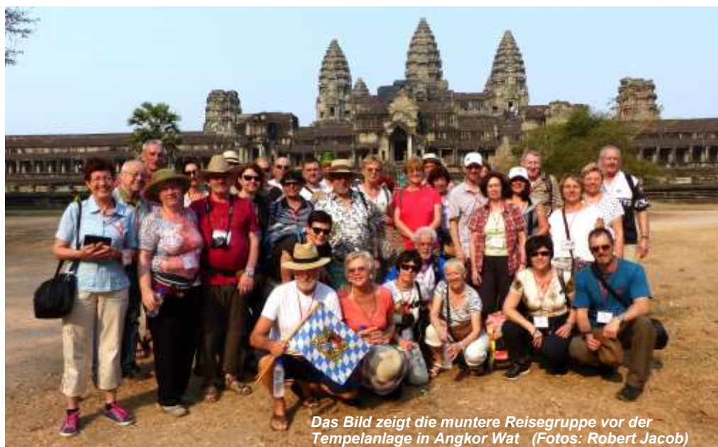
Das Bild zeigt die muntere Reisegruppe vor der Tempelanlage in Angkor Wat

Reiseziel 2017: Spaniens „feuriger Süden“: Andalusien