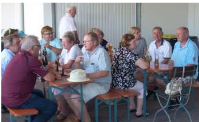
Text und Fotos: Kurt Schmidt