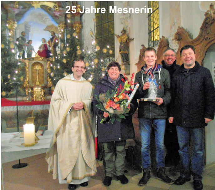
25 Jahre Mesnerin