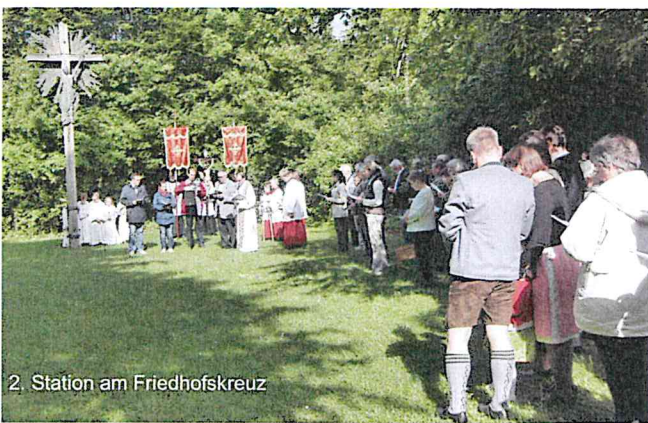
2. Station am Friedhofskreuz

Gesucht: Kuchenbäcker/innen! Tel. 1435 (B. Rid)